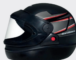
CAPACETE DE MOTO SAN MARINO 56/58/60/62