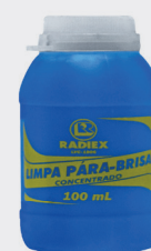
LIMPA PARA-BRISA RADIEX 100ML