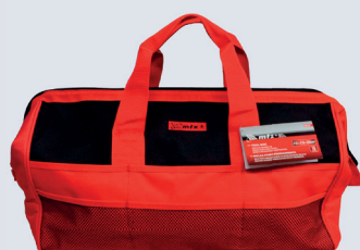
BOLSA DE FERRAMENTAS 32 DIVISÕES MTX