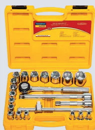
JOGO SOQUETE 1/2 DREBO 8 A 32 MM