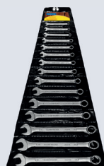
JOGO DE CHAVE COMB. 6 A 32 MM