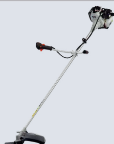
ROÇADEIRA TOYAMA 52CC 2T