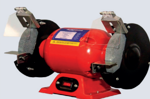
ESMERIL METALCAVA 1CV