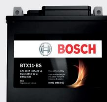
BATERIA DE MOTO BOSCH BTZ 6L-BS