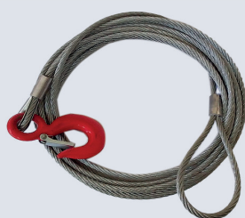
CABO DE AÇO 16MM (5/8) C/GANCHO 5MT